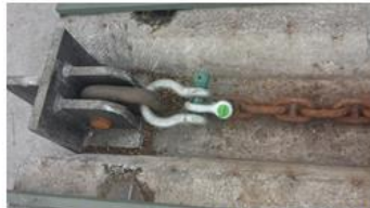
Fotos N°2 y N°3: conexiones a estrobo de tracción y base de tracción.